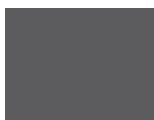
GRIS CHARBON (6558)